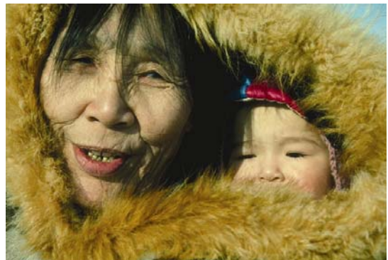
Mientras el ártico se calienta, las poblaciones nativas son las primeras en notar el impacto.

atmósfera y cuando se deposita sobre la nieve o el hielo. ii La absorción directa de los rayos de sol por el negro de carbón calienta la atmósfera. El negro de carbón también incrementa las concentraciones de gotas en las nubes, aumentando así el grosor de las nubes bajas que atrapan el calor que irradia la Tierra. Cuando el negro de carbón cae de la atmósfera sobre la nieve y el hielo, reduce la reflexión – o efecto reflectante – de éstas superficies e incrementa la posibilidad del derrite. Cuando estas superficies se derriten, el agua oscura o la superficie terrestre expuesta por debajo absorben más luz solar, causando un calentamiento adicional. iii James Hansen de la Administración Nacional de Aeronáutica y del Espacio (NASA) ha predicho que “el efecto hollín en el reflejo de la nieve puede ser el responsable de un cuarto del calentamiento global observado”. iv