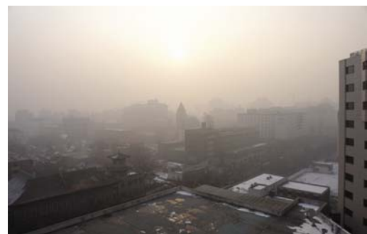
Negro de carbón es el mayor contribuidor de los humos marrones que frecuentemente cubren las ciudades asiáticas.

Las estrategias de reducción del negro de carbón salvarán vidas y mejorará la salud reduciendo estas formas de contaminación. El negro de carbón amenaza también vidas y a la salud indirectamente al acelerar el proceso del deshielo de los glaciares alrededor del mundo, como en el Himalaya y en las regiones andinas, poniendo en riesgo las fuentes esenciales de agua para millones de personas, y reduciendo el riego del agua en las épocas de sequía tan necesarias para el suministro de alimento en el Sur. xiii Debido a su naturaleza de poca duración, la disminución de el negro de carbón podría ser la mejor oportunidad para reducir estas amenazas.